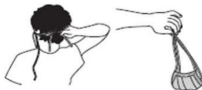
شکل شماره ۵- نحوه درآوردن ماسک

پس از آن دست هایتان را یکبار دیگر بشویید. با اینکار مطمئن می شوید که بعد از برداشتن ماسک، هیچ آلودگی بر دستان شما باقی نماند.