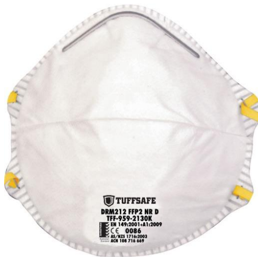
تصویر ۳- ماسک FFP۲ بدون سوپاپ