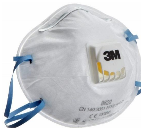
تصویر ۴- ماسک FFP۲ سوپاپ دار

شکل ۱- تصاویری از انواع ماسک های FFP۲ و N۹۵ سوپاپ دار و بدون سوپاپ