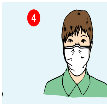
۴- ماسک را به گونه ای روی صورت تنظیم کنید که همه بینی و چانه را بپوشاند و روی صورت محکم شده باشد.