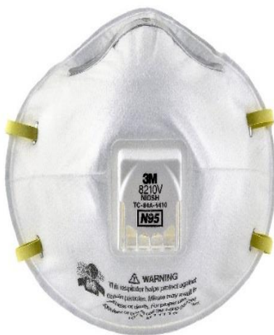
تصویر ۵- ماسک N۹۵ سوپاپ دار