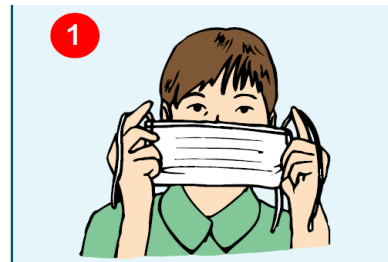
۱- ماسک جراحی را به گونه ای روی صورت قرار دهید که نوار فلزی در بالا قرار گیرد.