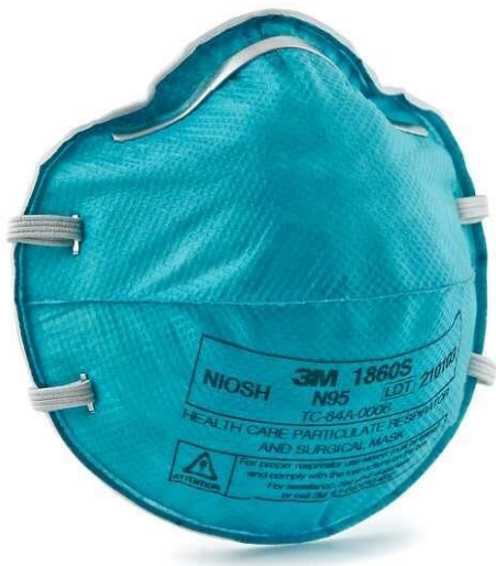
تصویر ۲- ماسک N۹۵ بدون سوپاپ