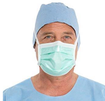
تصویر شماره ۱- ماسک جراحی (پزشکی)