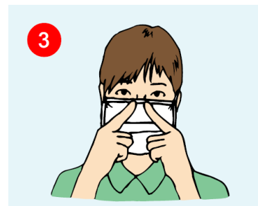
۳- نوار فلزی روی قسمت بالایی بینی را متناسب با بینی تنظیم کنید.